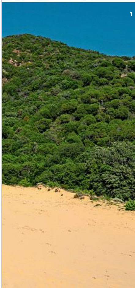
1 | Una corsa tra dune di sabbia e macchia mediterranea presso Buggerru (Su). 2-3 | Nella cucina e sulla spiaggia del Warung beach club , a Masua (Su), dove fanno base gli arrampicatori che sfidano la roccia del Pan di zucchero .