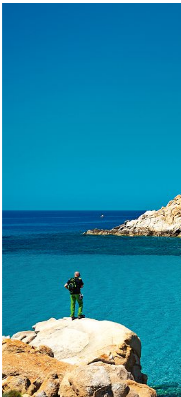
Escursione lungocosta sotto Capo Spartivento , nell'estremo sudovest della Sardegna, con il faro , oggi diventato hotel di lusso. Molti, in quest'area, gli operatori che offrono tour per camminatori esperti e no.