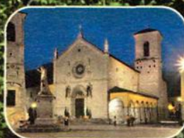
BASILICA DI SAN BENEDETTO A NORCIA (PERUGIA)